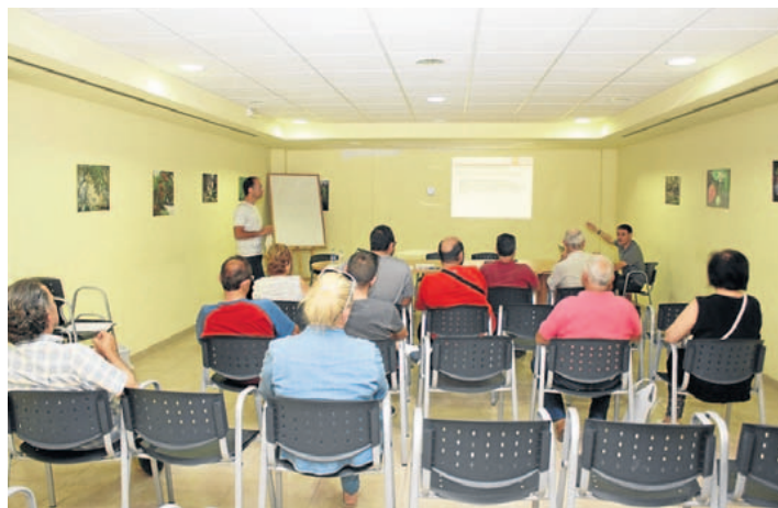
Una imagen de una de las sesiones de asesoramiento. :: UAGR

Para este nuevo periodo la Unión de Agricultores ha preparado un asesoramiento más completo y eficaz, ajustado a las necesidades de agricultores y ganaderos, y enfocado a la mejora de la rentabilidad de las explotaciones. Con la experiencia adquirida, se ha diseñado un asesoramiento especializado en subvenciones, riesgos laborales, técnicas de cultivo innovadoras, gestión del agua y del abonado, modernización de la explotación, requerimientos ganaderos, etc., incluyendo también la Geotrazza, la aplicación para el móvil que permite cumplimentar el cuaderno de campo eficaz y cómodamente en tiempo real.